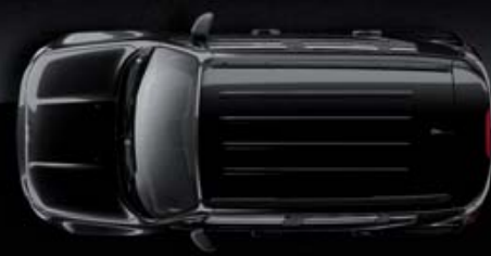
Preto Carbon Metalizado