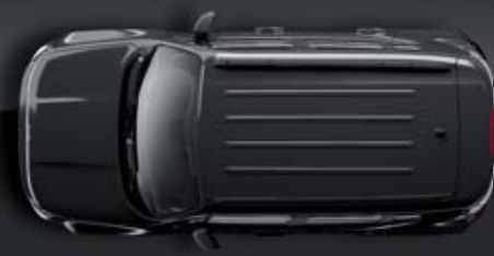
Cinzeno Granite Crystal Metalizado