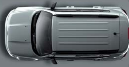
Cinzeno Glacier Metalizado