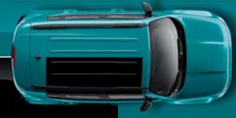
Azul Bikini Metalizado