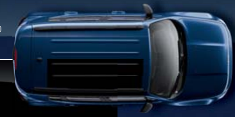
Azul Jetset Metalizado